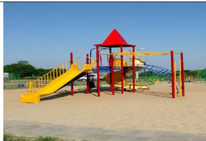
Оборудование детских площадок и игровых комплексов.